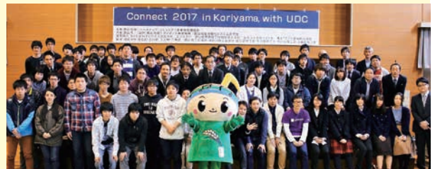
多くの皆さんが参加しました

※UDC:オープンデータや地理空間情報を活用し、地域の課題解決を目的としたアプリケーションやサービスなどの作品を募集し、全国規模で行われるコンテスト