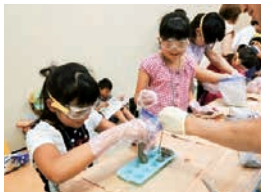
コンクリート流し込み