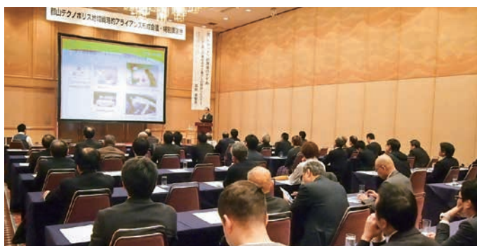
多くの方に参加いただきました(特別講演会)

平成29年度は、受発注の推進に向けた活動を強化し新たに企業製品発表会(プレゼン会)の拡充と当形成会議を広く知ってもらうため、特別講演会を開催しました。