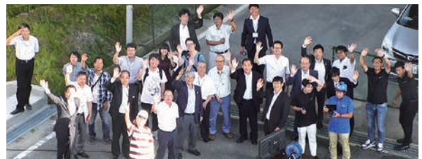
上空からの記念撮影