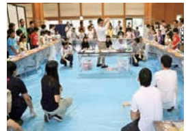
子田先生からの説明(須賀川会場)