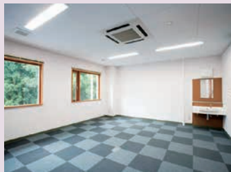
起業支援室(事務室タイプ)