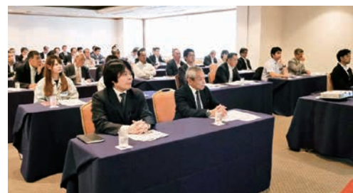
多くの方が参加した企業製品・研究成果等発表会 (第5回企業製品等発表会)