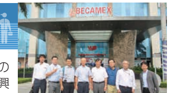
11月ベカメックスの視察を終えて(海外視察)

会員相互の技術、情報などの交流と幅広い研究を通して、新技術、新商品、新事業の開発と新市場の開拓を促進するとともに、生産・販売面での相互協力を促進し、会員企業の成長発展と地域産業の振興に貢献することを目的に活動しています。