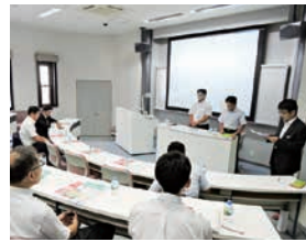
産学連携コーディネート業務 金融機関勉強会