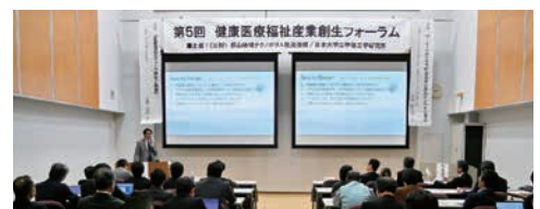
中村アクセンチュア・センター長による講演