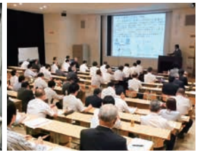
産学連携コーディネート業務 産学連携セミナー