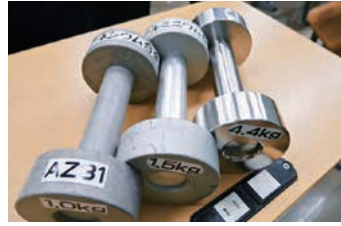
素材の違いによる重さ比較 (不二ライトメタル株式会社)