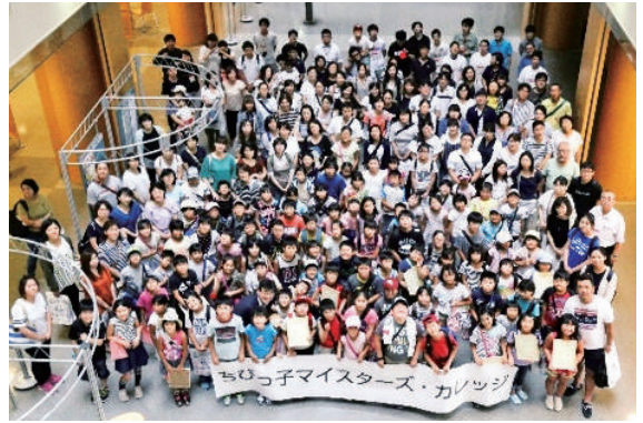
集合写真(郡山会場)

※須賀川会場に於いては、コンクリートの破壊実験の様子は映像で学び破壊されたコンクリートを持参し子供たちは手に取り学んでいました。