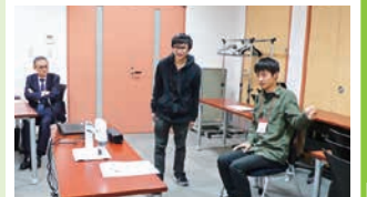
イノベーションマスターコース