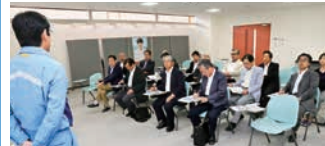
6月 東北電力原町火力発電所視察