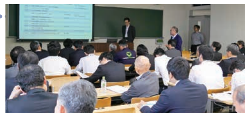
熊本からお越しいただいた不二ライトメタル株式会社のプレゼン