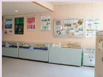
成果品展示コーナー