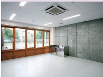
起業支援室(実験室タイプ)