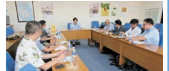
11月 JETROホーチミン事務所