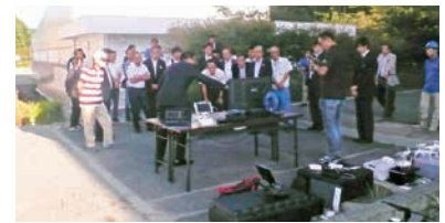
ドローンの説明を受ける参加者