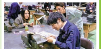
ファンダメンタルテクノロジーコース