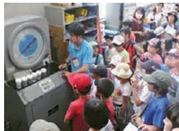
コンクリート破壊実験