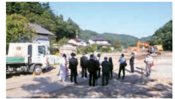
復興交流館・蔵改修の敷地を視察